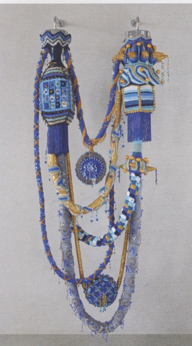
Joana Vasconcelos, Blue Rose 1 , 2016, 246 x 95 x 47 cm. © de l'artiste

Artiste protéiforme, Joana Vasconcelos (Paris, 1971) compose un univers extravagant, à la croisée de la sculpture et de l'art textile. La plasticienne installée à Lisbonne, jongle avec des disciplines directement empruntées